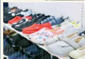
▲充実した介護用品のラインナップ