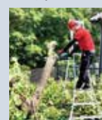
▲環境整備として、不要木の伐採を行う様子

近年、現場では「昨年までは自分でできていたことが、今年は難しくなってきた」という高齢者の方のお声を伺う機会が増えています。段差の上り下りや通院、庭木の手入れなど、日常の小さな負担が大きな課題となるケースが多く、それでも「住み慣れた自宅で暮らし続けたい」という願いは変わらず寄せられています。