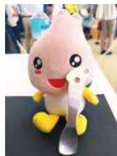
万博で製作してもらった スプーン