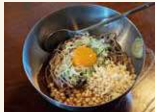
冷たぬきそば 500円(税込み)