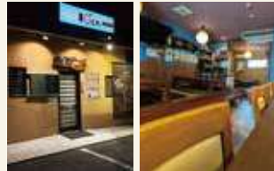
カウンター(8席)や掘りごたつ(6席×2)の奥には座席があり、少人数の宴会等にご利用できます。

店舗情報 住所：各務原市蘇原栄町1丁目35 丹羽ビル104 電話：070-6533-2382 営業時間：18:00~24:00(L.O. 23:30) 定休日：日曜日・第3月曜日 ※全席喫煙可。20歳未満の方は入店できません。