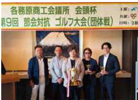
優勝チームの皆さん

して(株)日本一ソフトウェアから優勝カップとカニ鍋セットが贈られました。 上位入賞は次のとおりです。