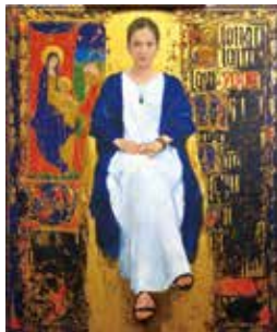
藤森兼明 「アドレージョン オブ マギ」2020年

90歳を迎えた藤森兼明の画業を「人の姿」と「祈りの美」を軸に迎える特別展。学生時代の初期作から、ビザンチン美術や中世彩色写本に着想を得た荘厳な祈りの代表作までを展覧。中世写本の傑作との共演も必見!