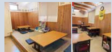
店内は、小さなお子さま連れのご家族からご年配の方まで利用しやすいです。

きしめんを食べるのであれば、ここ!昔から地元で親しまれている『むさしの』。特製味噌煮込みきしめんが人気です。季節ものを含め、どのメニューも注文をいただいてから、きしめんを切って茹でるため、常に茹でたてを味わうことができます。実際に食べてこそ伝わるきしめんへのこだわり。ご来店して、ぜひご堪能ください!