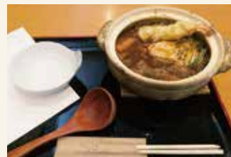
■特製みそ煮込み (海老天、鶏肉、玉子入) 1,650円(税込)

住所：各務原市那加前洞新町3丁目50 電話：058-381-9202 営業時間：昼11:00～14:00 夜17:00～19:30(平日) 17:00～20:00(土日祝) 定休日：水曜日・木曜日 ※品切れ時には早めに閉店させていただきます。 場合がございます。