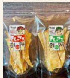
■きしップス 350円(税込) きしめんのチップス。 カリッとした食感で、おやつ、おつまみにおすすめです。