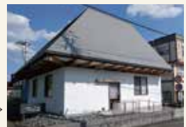
『むさしの』の看板が目印→