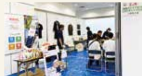
▲2025年の産業フェスタに参加。子供たちに楽しくウールの特性を知ってもらう。