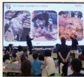
▲市内のショッピングモールで実施したウールラボの様子