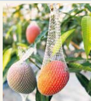
ネットに落ちた完熟マンゴー「ルビーの輝き」1個3,500円~化粧箱入りで地方発送も承ります