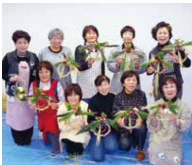
平成21年に実施した様子