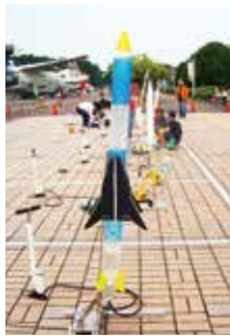
水ロケット教室のほか、開会式で発射します