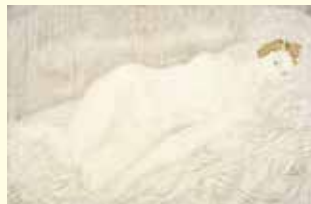
レオナルド・フジタ(藤田副治)「横たわる裸婦」 1927 メナード美術館 初公開コレクション © Fondation Foujita / ADAGP, Paris & JASPAR, Tokyo, 2015 C0679