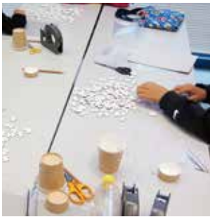
講座「宇宙飛行士になれるかな」では飛行士の訓練を体験します