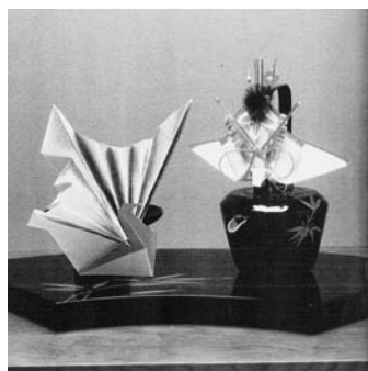
今回の講座で作る正月飾り

【女性会活動予定】 役員会 12月6日 正月飾り講座 12月9日 チャリティーディナーショー 1月22日