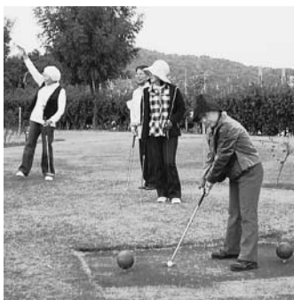
パターゴルフを楽しむ様子

パターゴルフ交流会を開催 11月8日、各務原リバーサ イド21で、「会員の交流」を目 的としたパターゴルフ大会を 開催いたしました。今年5月 にも開催し、参加者から「楽 しかった」と言う声をいただ いたため、秋の企画として再 度行いました。 秋晴れの下、9名の女性会 員が参加し、女子プロ気分 で見事にカップに入れた人、悪 戦苦闘する人など、楽しくプ レイすることができました。 また、プレイ終了後は、昼 食交流会を開催し、会話も弾み、 楽しく会員の交流を図りました。