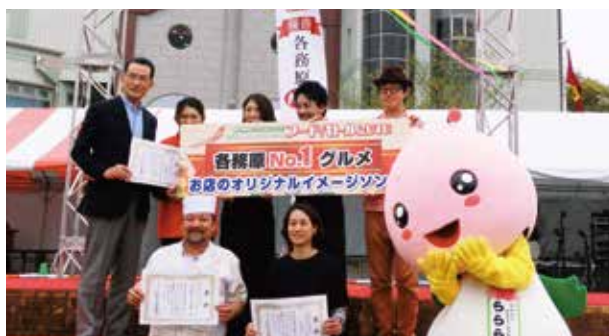
グランプリの様子

今年も、食の祭典「かかみがはらフードバトル2016」が各務原市民公園内にて開催されました。各務原市内の飲食店が大集結し、大勢のお客さんで会場が賑わいました。 今回のグランプリは孔明飯店の「若鶏の唐揚げ」で1,677票、2位和洋料亭 まき本店の「ステーキ」で997票、3位はたこばやしの「たこ焼」で796票といった結果になりました。 ぜひ一度お店に足を運んで、味わってみてください。