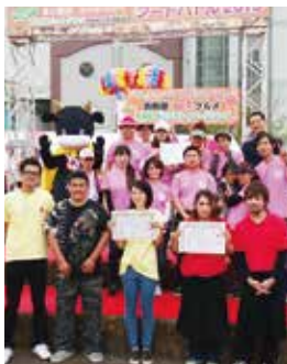
昨年の順位発表の様子

日時 4月9日(土)10日(日) 午前10時~午後5時 場所 各務原市民公園 詳細 桜まつり実行委員会(フードバトル事務局・各務原市商工振興課) 058-383-6912