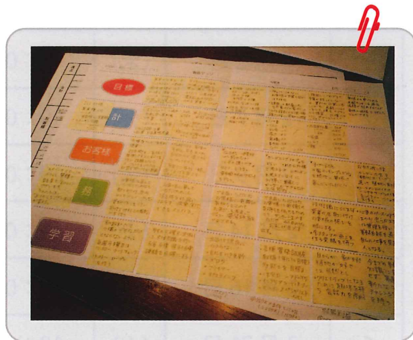
戦略マップ作成イメージ

これまで事業のアイデアはあったけど、忙しくてなかなか実行できないでいたり、セミナーでよい話は聞いたけど、思うように展開できなかったことはありませんか。その理由は中小企業特有の事情があるからです。本セミナーでは、「戦略マップ」という経営戦略を実行するための道具を使って、これまで経営者やリーダーの方が抱えていた課題を克服できるようアドバイスします。