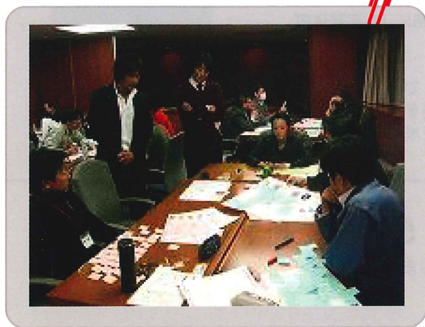
戦略マップ作成セミナーの様子 (H22)